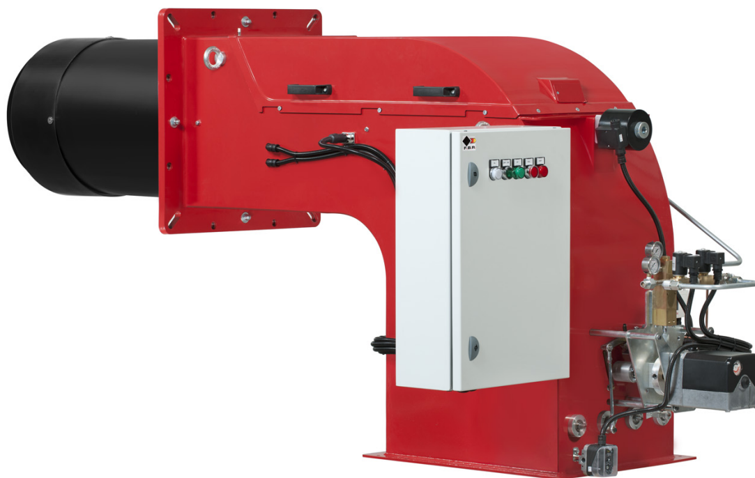
Fig. 2 HI-FGP 650/M