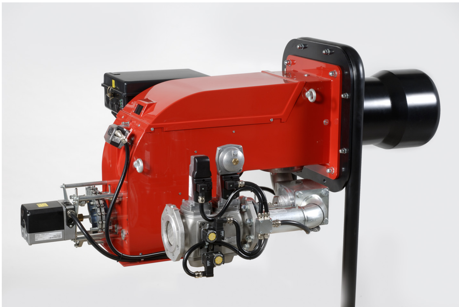
Fig. 4 HI-GAS P350/M CE